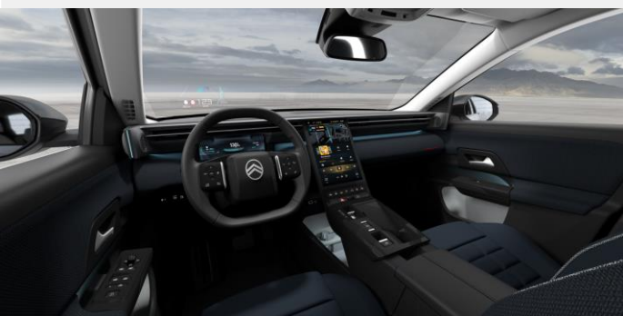
Ambiente Interior de Serie - HYPE BLUE TRIM