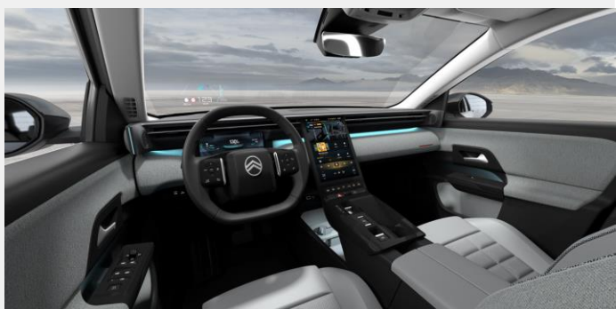
Ambiente Interior de Opción- Ambiente Hype Grey